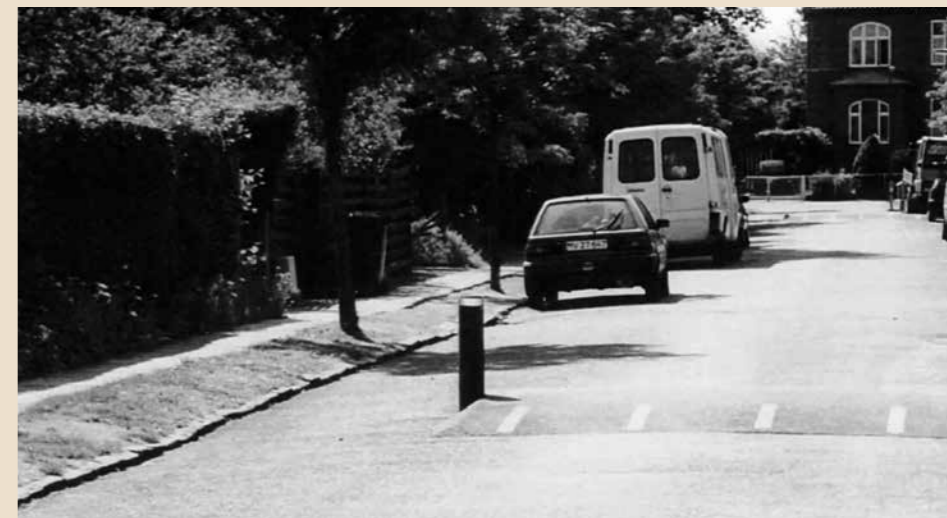
Stillevejsbump på Heklas Allé.

1991: På Heklas Allé og Thingvalla Allé konstateres beskadigelse af vejbrøndene, som følge af nedlægning af gas- og fjernvarmeledninger. Man havde ikke tilsluttet kloakledningen på vejbrønden til hovedkloakken. Samtlige kloakker skal nu gennemgås og samtlige vejbrønde er forsøgt spulet igennem. Det ser ikke godt ud. Ingolfs Allé på sydsiden: Fortovsfliser og kantstene er renoveret.