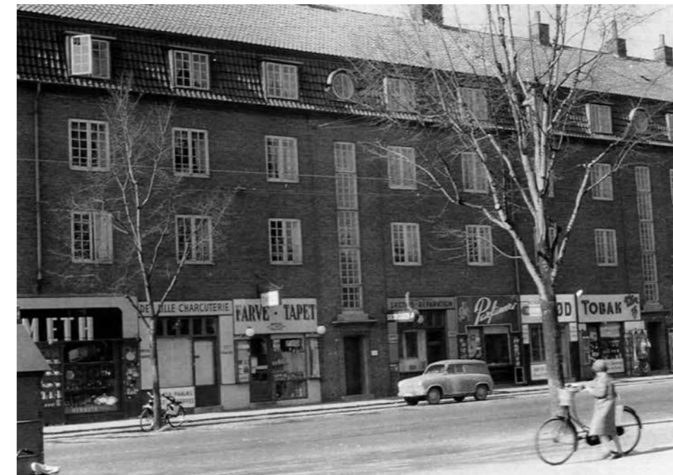
Ingolfs Allé, årstallet er ukendt før 1925. Der hvor Ingolfhus ligger i dag var der gartneri.

De blev lagt servitutter på disse facadegrunde. Det hedder bl.a., at ved høj bebyggelse skal anlægges sti på 15 alen, ved lav bebyggelse skal der anlægges haver.