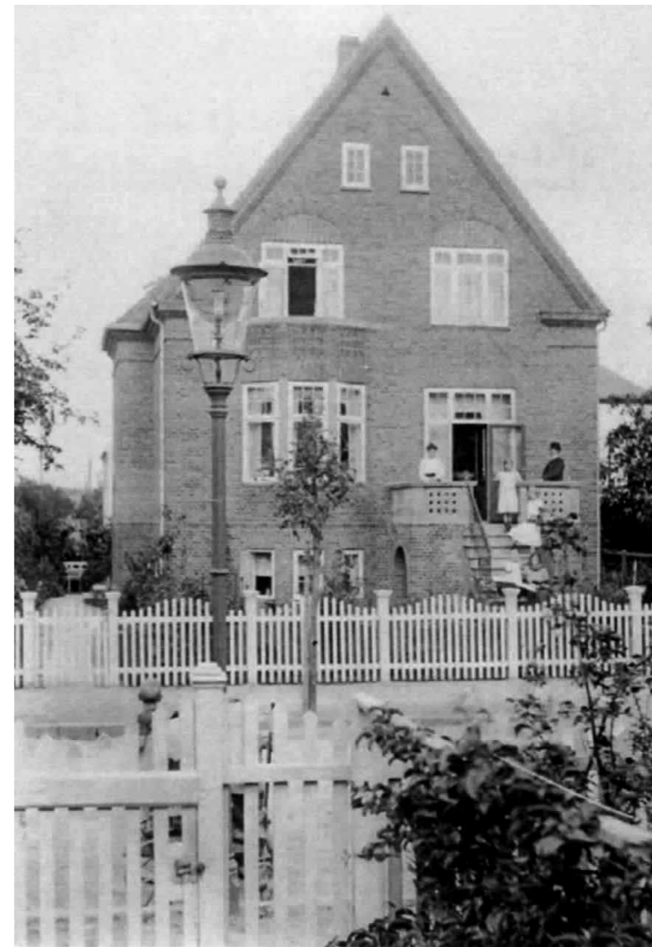
Heklas Allé 7 ca. 1929.

30'ernes krise gik tilsyneladende forholdsvis smertefrit hen over foreningen, hvilket til dels kan tilskrives ovenstående erhvervs kategorier. Dog kan man se, at huspriserne i området falder drastisk op gennem årtiet, og der er da også en del restancer i foreningen. I dette årti så man et eventyrligt syn: en Zeppelin svævende over området.