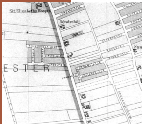
Grundejerforeningen 1906 omgivet af marker.