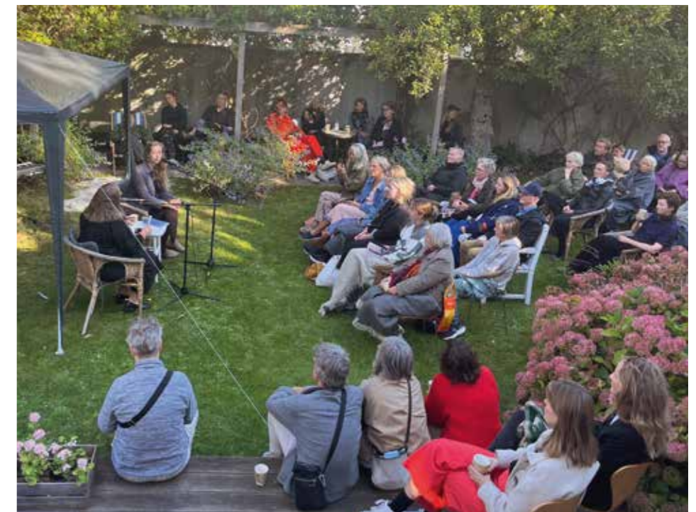
Amager Litteraturfestival i haven på Ingolfs Allé 14.

Siden 2020 og frem til skrivende stund (2024) har der hvert år i september været afholdt en lokal litteraturfestival: Amager Litteraturfestival. Festivalen arrangeres i samarbejde mellem Ingolfs Kaffebær, Zittans Boghandel, bibliotekshuset på Rodosvej og beboere på Ingolfs Allé. En hel september-weekend står i litteraturens tegn. Der er oplæsning og samtaler med etablerede og nye kunstnere, blandt andre lokale forfatternavne som Morten Pape – og der er litterære arrangementer for børn. Flere haver på Ingolfs Allé åbnes og danner scene for poesioplæsning og cool jazz. Ved havelågerne sælges og byttes der bøger – og der arrangeres litterære vandringer, hvor historiske forfatternavne fra vores lokalområde opfriskes.