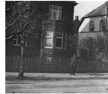
Ingolfs Allé, maj 1924.