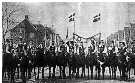
Tøndeslagning Gimles Allé ca. 1910.