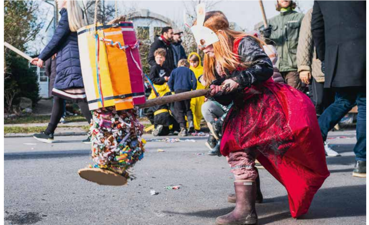
Fastelavn 27. februar 2022 Heklas Allé.