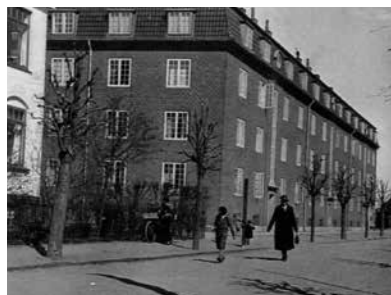
Ingolfhus, ca. 1930.

I 1925 opføres Ingolfhus på et område svarende til 8 parceller. Således inddrog man, udover de 4 facadegrunde, 4 almindelige udstykninger, så at der kunne bygges en større beboelsejendom.