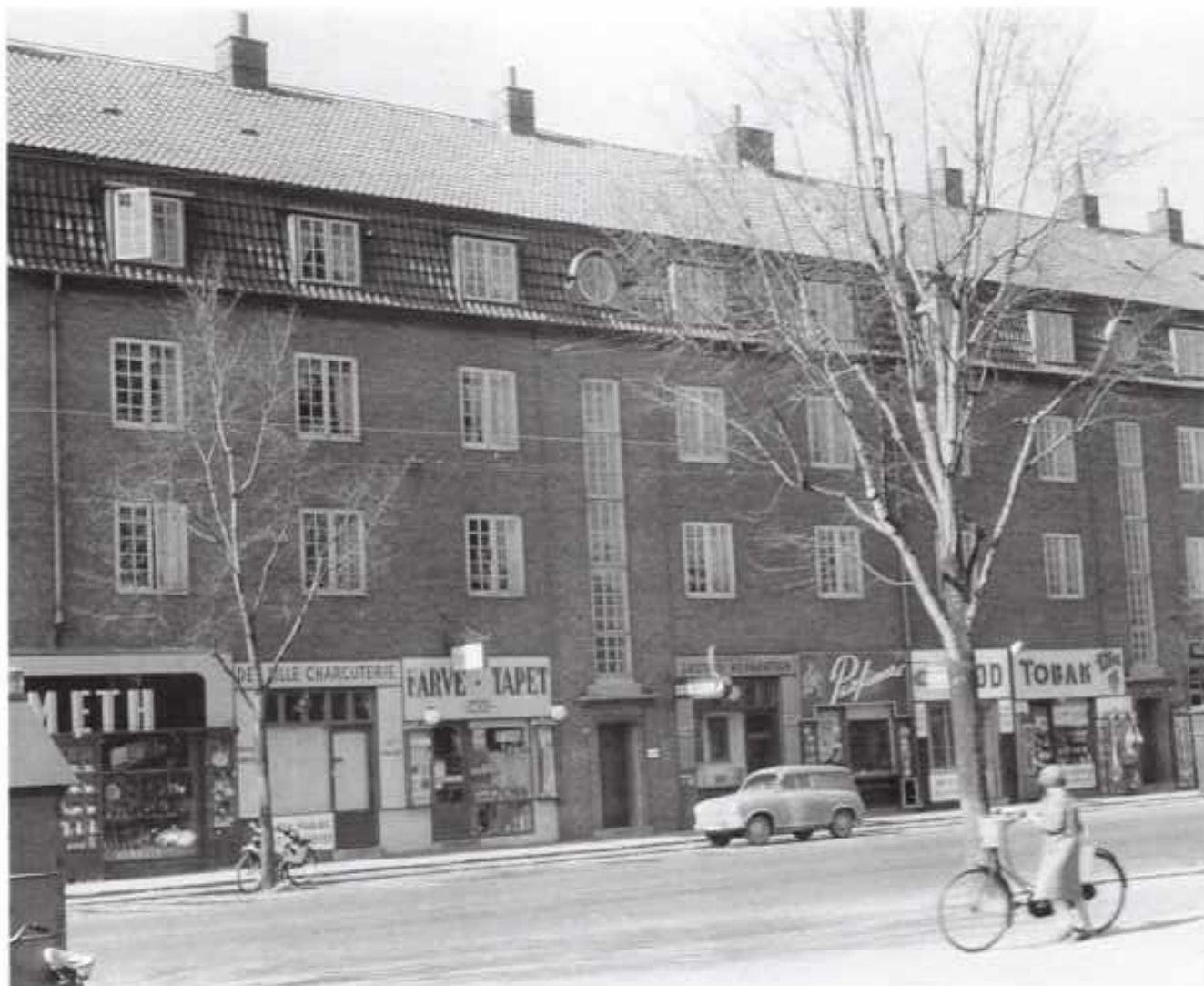
Amagerbrogade mellem Gimles Allé og Ingolfs Allé 1950

De blev lagt servitutter på disse facadegrunde. Det hedder bl.a, at ved høj bebyggelse skal anlægges sti på 15 alen, ved lav bebyggelse skal der anlægges haver.