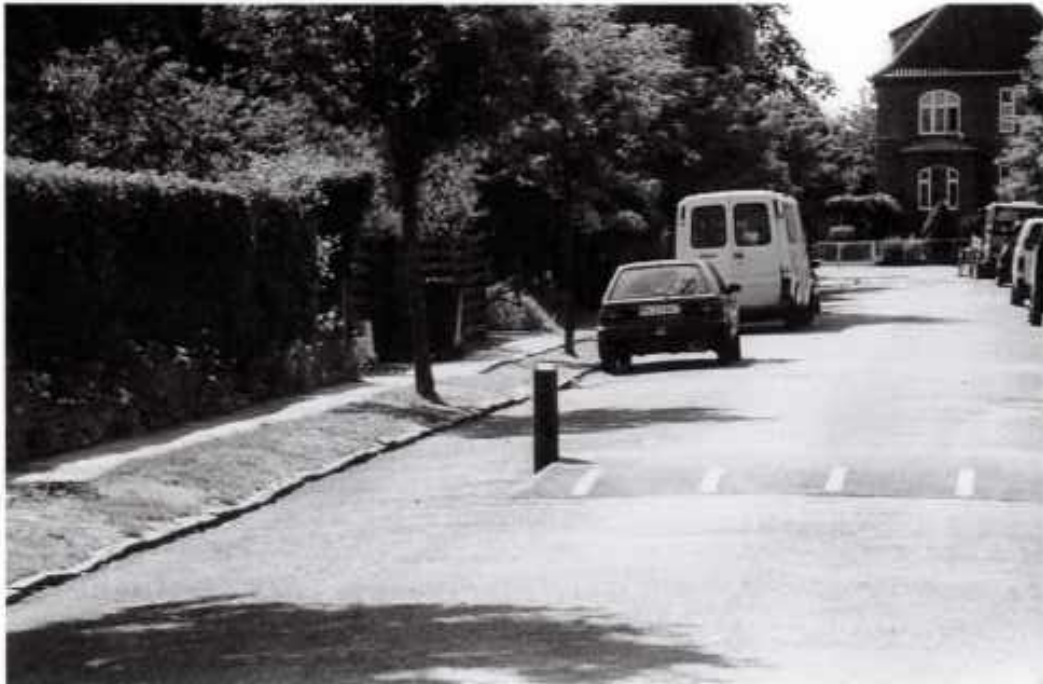
Stillevejsbump på Heklas Allé

Forslag om, at de resterende træer i foreningen udskiftes i 1989 bliver vedtaget.