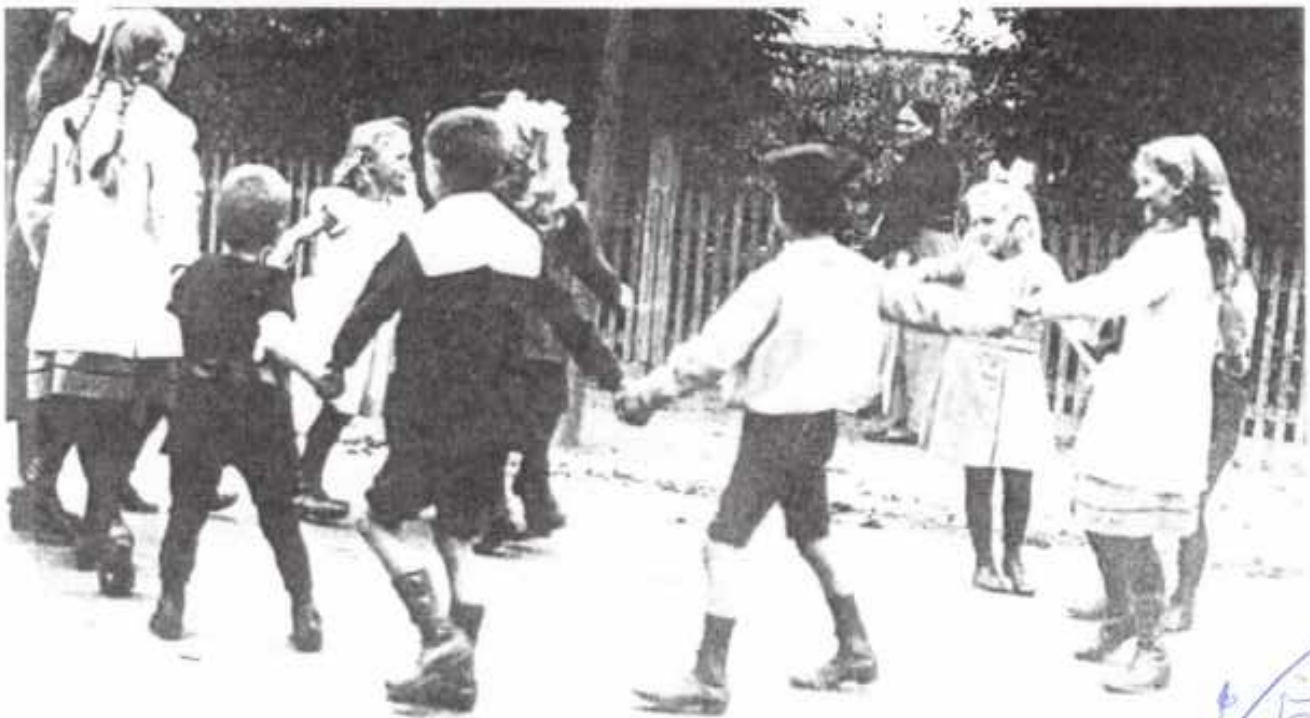
Børnene leger rundkreds foran huset Thingvalla Allé 12 ca. 1913/14