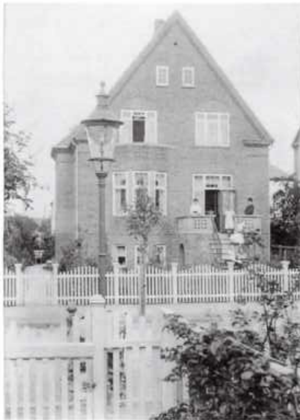
Heklas Allé 7 ca 1929.

Husene blev typisk beboet af 2-3 familier (alt efter størrelse), hvor ejeren oftest boede i den største lejlighed i stuen, mens resten blev lejet ud. Der kom jævnligt handlende til kvarteret, brødmænd, fiskemand, mælkeemand og kul- og koksvogne.