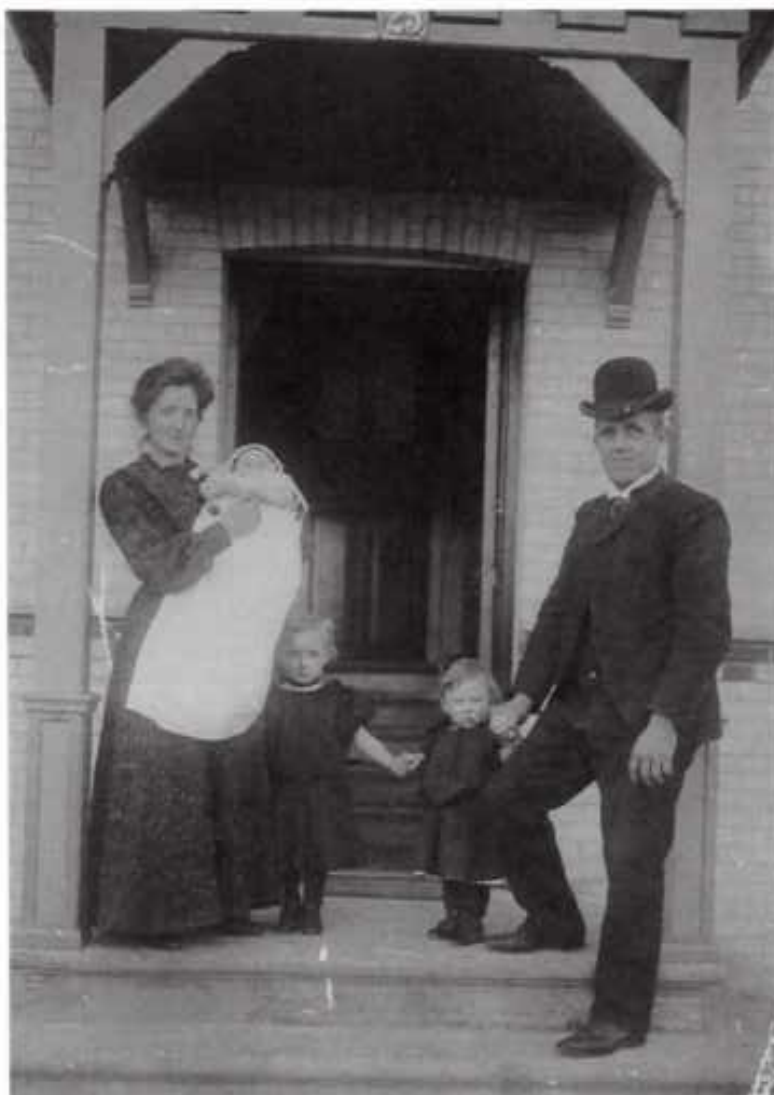
Barnedåb Thingvalla allé 25 ca. 1905