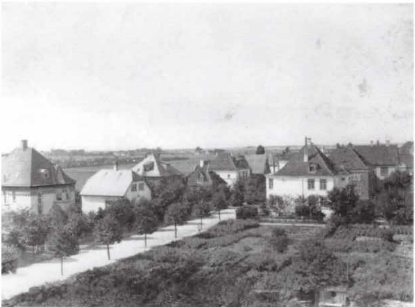
Ingolfs Allé årstallet er ukendt

I 1926 opføres Ingolfshus på et område svarende til 8 parceller. Således inddrog man, udover de 4 facadegrunde, 4 almindelige udstykninger, så at der kunne bygges en større beboelsesejendom.