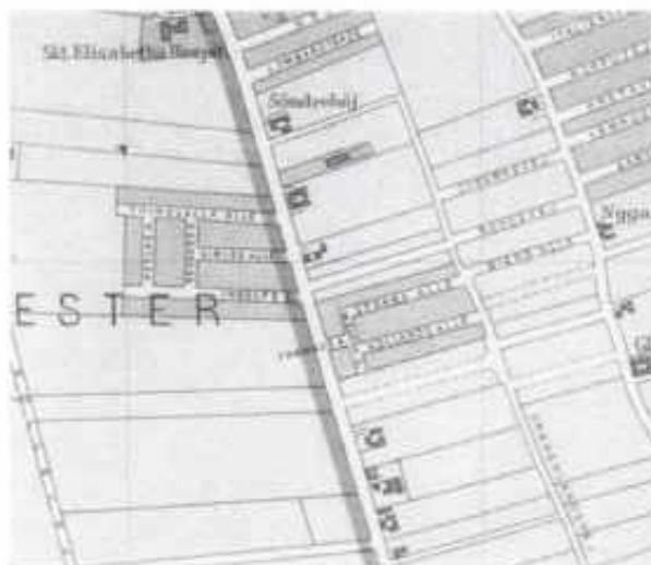
Grundejerforeningen 1906 omgivet af marker.

Selve bebyggelsen af områder så langt ude på Amager startede med oprettelsen af Eberts Villaby i 1895. Man må formode, at det bl.a. var de forholdsvis lave jordpriser, som fik byggeforeningen til at købe jord på dette sted, men også fordi Sundbyerne ikke var ukendt for Holmens folk.