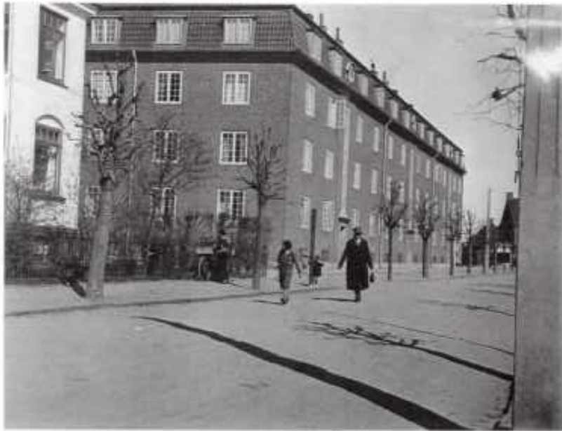
Ingolfshus ca. 1930

"Højhuset" (Gimles Alle 2) påbegyndtes i 1929 og blev taget i brug i juni 1930, men uden bygningsattest. Der var nemlig problemer med ydermuren, hovedtrappen og vinduerne, og der blev kørt retssag om ulovlighederne. I 1931 blev arkitekt og bygherre idømt en bøde på hver 100 kr.