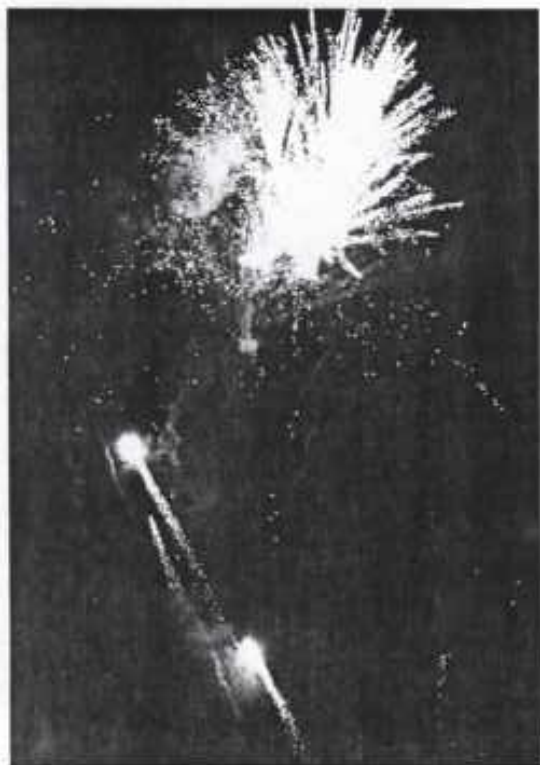
1999: 100 års Jubileum