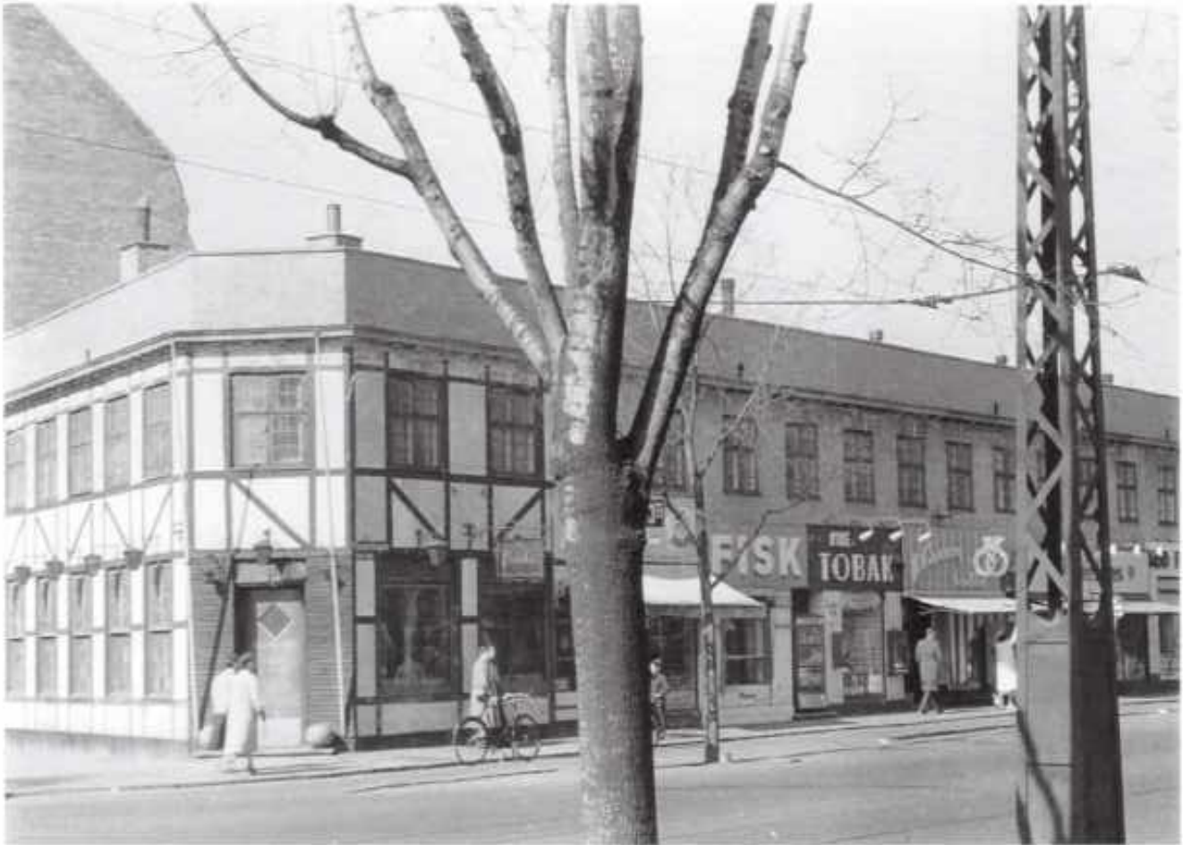
"Manilla" Hjørnet af Gimles Allé 1950

I 1939 åbnede restaurationen Manilla på hjørnet af Gimles Alle /Amagerbrogade. Denne restauration bestod – senere med navnet Sportscafeen – indtil 1961, hvor Importøren rykkede ind.