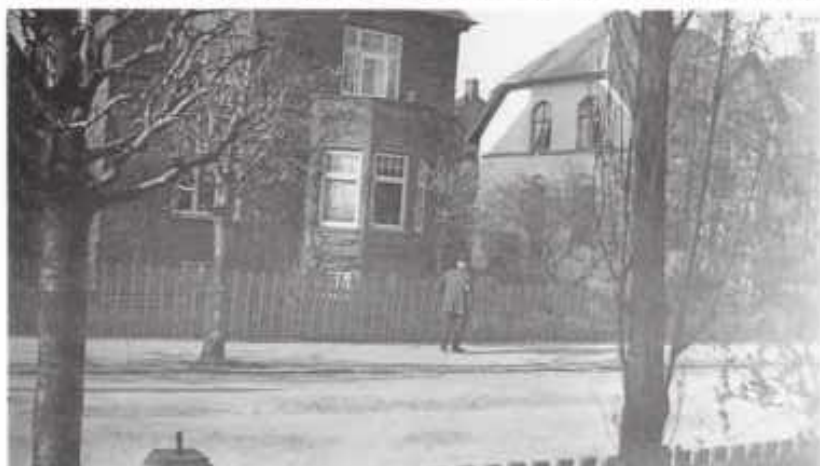
Ingolfs Allé maj 1924